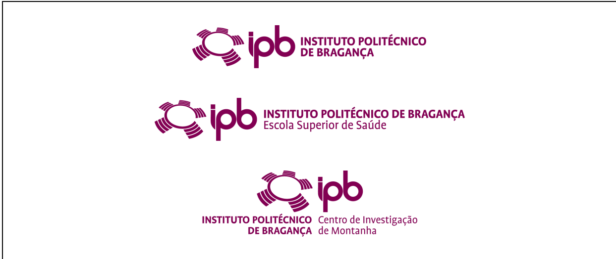
O símbolo do IPB e algumas variantes.