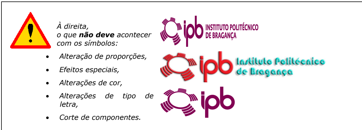
Não são aceitáveis cortes, deformações, efeitos ou alterações de cor.