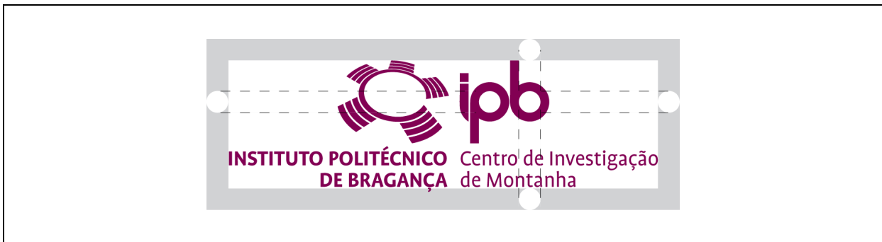
O símbolo deve ser defendido por uma área mínima de protecção (a cinza, na imagem).